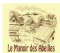
Le Manoir des Abeilles