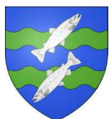
Mairie du Mont-Saint-Michel