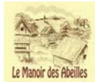
Le Manoir des Abeilles