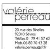
Conseil en communication graphique