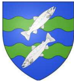
Mairie du Mont-Saint-Michel