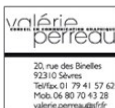
Conseil en communication graphique