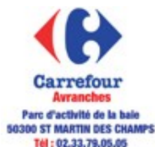
Conseil en communication graphique