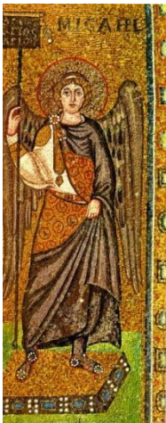
Saint Michel, Ravenne

Ce combat, nous le savons bien, est à la fois intérieur et cosmique et il nous dépasse infiniment. Qu'il est bon de savoir que Saint Michel se tient à nos côtés et lutte avec nous !