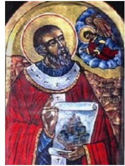
Songe Saint Aubert

Dieu parle parfois aux hommes à travers des messagers angéliques. Il l'a fait tout au long de l'histoire biblique et continue à le faire aujourd'hui. Si le Mont est aujourd'hui ce haut lieu spirituel, c'est parce que Saint Michel a demandé en songe à l'évêque Aubert d'y bâtir un sanctuaire qui lui soit consacré.