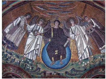
Le Christ en majesté, Ravenne

Saint Michel éclaire et guide chacun sur son chemin vers Dieu, le défend contre le diable et le soutient puissamment à l'heure de la mort, passage vers la vie éternelle.