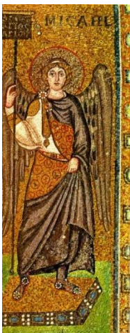
Saint Michel, Ravenne

Ce combat, nous le savons bien, est à la fois intérieur et cosmique et il nous dépasse infiniment. Qu'il est bon de savoir que Saint Michel se tient à nos côtés et lutte avec nous !