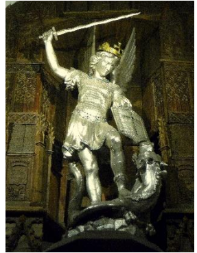
La statue Saint Michel restaurée à l'église Saint Pierre

Les anges sont littéralement nos « ap-porteurs ». Ils présentent au Seigneur nos prières et chacune de nos vies en union avec la vie donnée du Christ pour le Salut du monde.